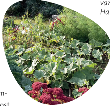
Maja van Haaren

In de buurtmoestuin Het Julianahofje telen we groenten op een natuurlijke manier en maken we een wormenhotel zodat we onze eigen natuurlijke compost kunnen maken. In een wormenhotel leven wormen die compost maken van afval; ze maken er vruchtbare aarde van die bomvol mineralen zit. Deze compost hebben we hard nodig om onze bodem vruchtbaar te houden zodat we er opnieuw voedsaam eten op kunnen laten groeien. Tijdens deze workshop leer je met eenvoudige middelen een wormenhotel te maken en te verzorgen.